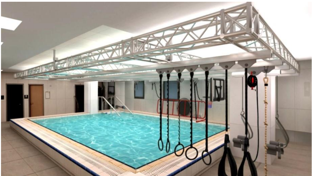
צילומים ממערכות נינג'ה בבית החולים שיבא ובמרכז הרפואי עמק